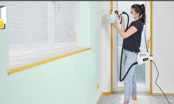
1300 ml Aufsatz für Wandfarbe